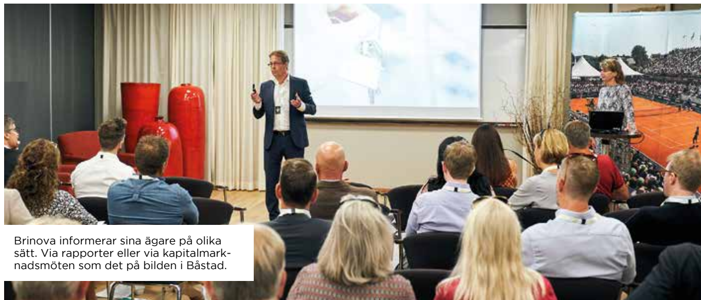
Brinova informerar sina ägare på olika sätt. Via rapporter eller via kapitalmarknadsmöten som det på bilden i Båstad.

Varje år görs en utvärdering av styrelsens sammansättning och funktion. Den genomförs som en enkät som går ut till alla